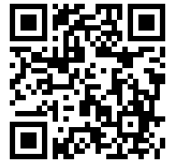
みま～も桃園 ホームページ