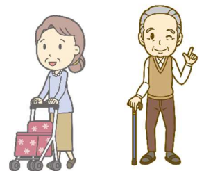
お出かけ安心キーホルダーはみま～も桃園の登録商標です。