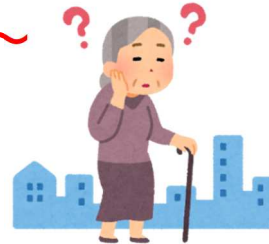
迷子や徘徊のとき