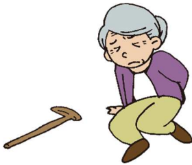
動けなくなったとき

外出先で救急搬送されたり、認知症による徘徊中や迷子などで保護されたとき、迅速な身元確認を簡単に行うことができます。安心してお出かけして頂くことができる「全世代型」のキーホルダーを年齢・地域に関係なく、ご希望の方に作成します。